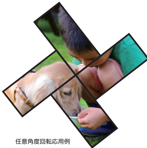
任意角度回転応用例